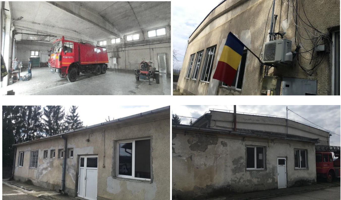
Figura 6 Clădirea administrativă C1 a GICS și garajul

În urma unei expertize efectuate de un expert tehnic autorizat, clădirea a fost clasificată în clasa I de risc seismic, care include clădirile cu un risc ridicat de prăbușire sub efectul cutremurului de proiectare. O nouă clădire va fi construită pe aceeași parcelă de teren.