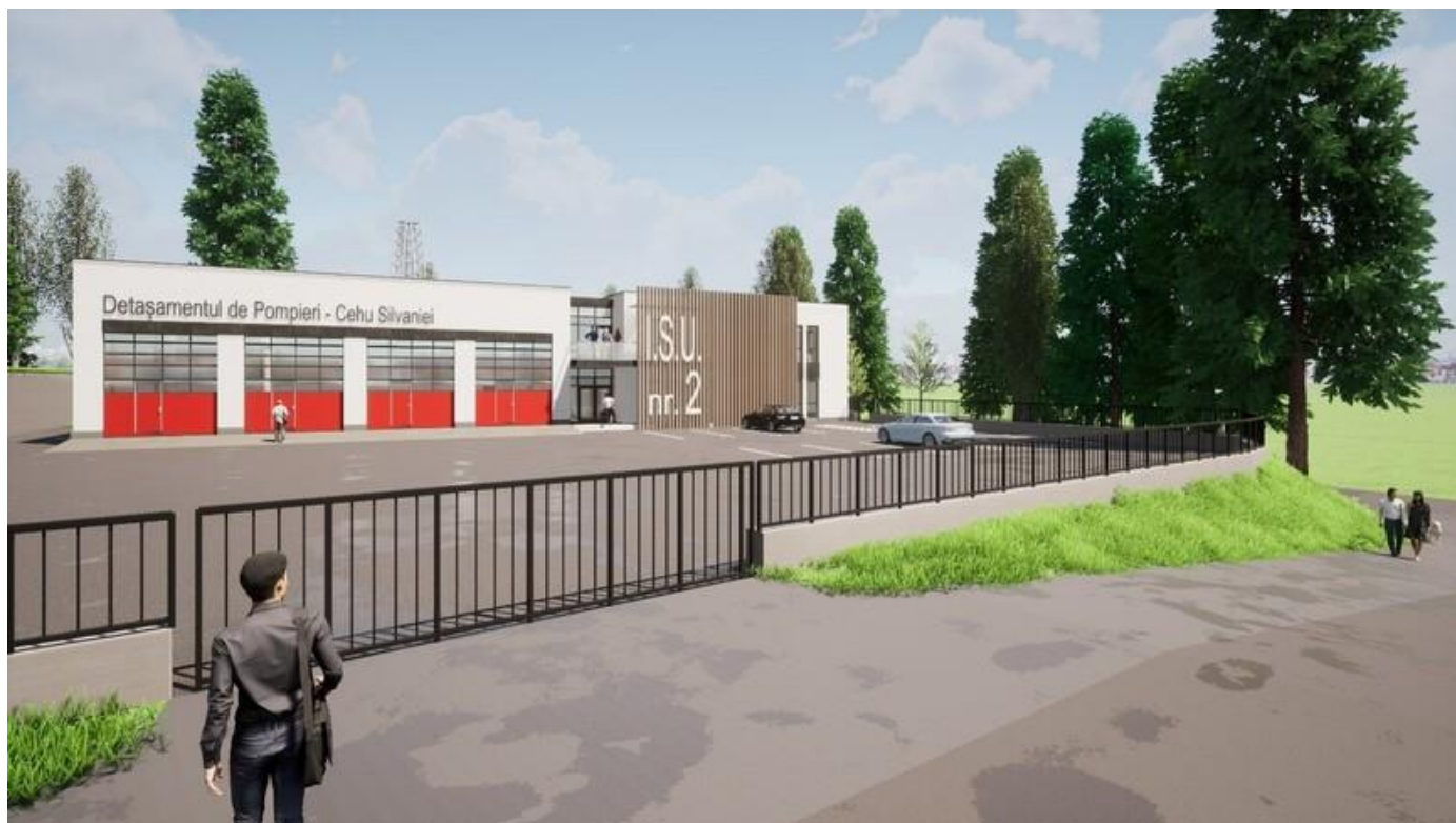
Figura 7 Noua clădire propusă

În plus, clădirea va corespunde celor mai noi cerințe de eficiență energetică și va fi dotată pentru a asigura standarde înalte pentru personalul GICS și pentru pompierii și personalul SMURD care își desfășoară activitatea în clădire.