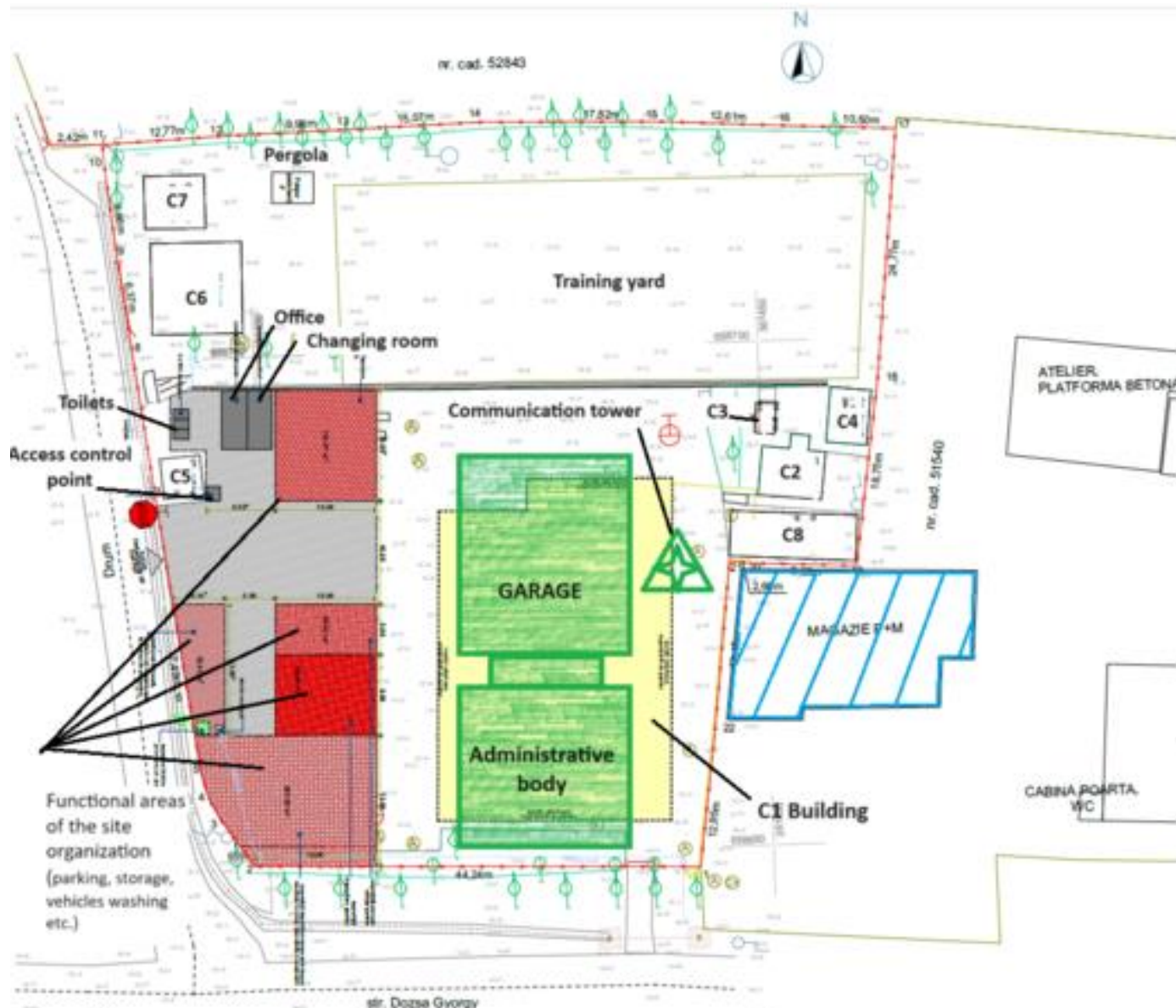
Figura 3 Clădirile existente și poziționarea propusă a noii clădiri; schița organizării de șantier

Zona din partea de nord a parcelei de teren - unde se află curtea de antrenament și alte trei construcții mici - va fi împrejmuită și nu va fi utilizată pentru activitățile de construcție.